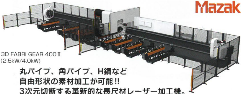
3D FABRI GEAR 400 II (2.5kW/4.0kW)